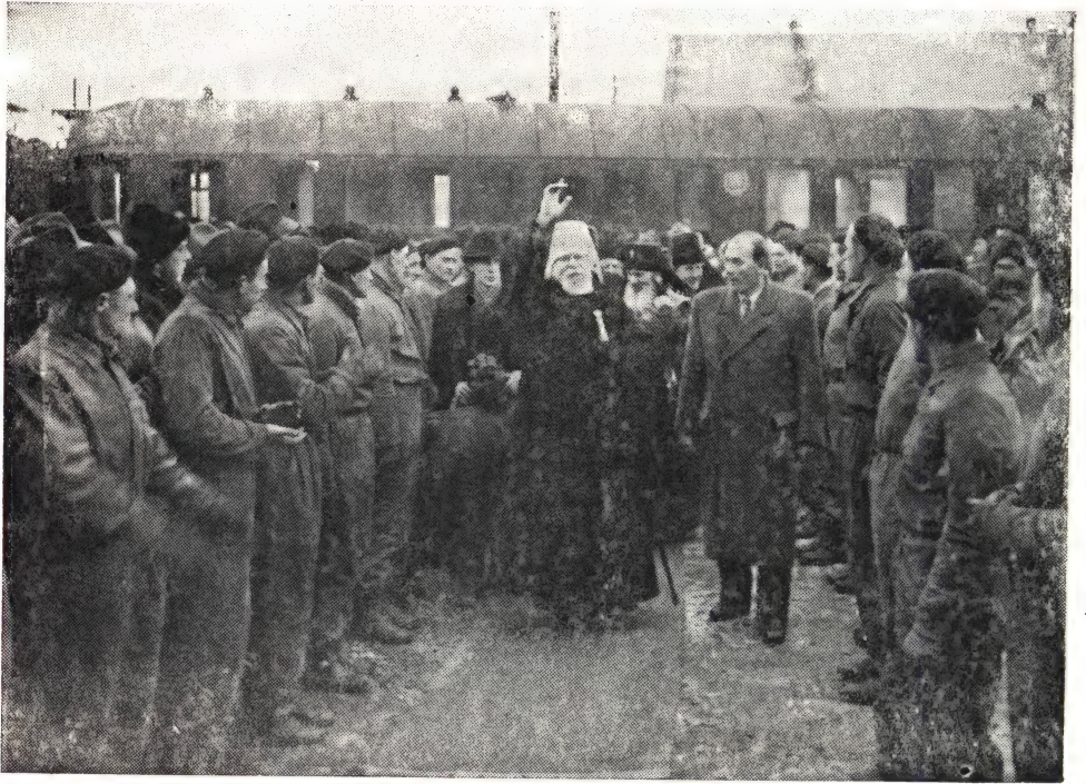
Делегация Русской Православной Церкви на вокзале в г. Пршеве

В честь делегации был устроен обед в Народном Доме, во время которого были произнесены речи министром А. Нейманом и другими присутствующими, на которые несколько раз отвечал я. Министр А. Нейман в своей речи, между прочим, говорил: «Позвольте мне приветствовать Вас от имени Правительства Чехословацкой Республики и в связи с торжествами высказать искреннюю радость Правительства и народа Республики по поводу посещения делегации Русской Православной Церкви. Приветствуем Вас, редкие гости, прежде всего как членов и граждан славного Советского Союза. И столь же радостно мы приветствуем в Вашем лице представителей великой Русской Православной Церкви. Подобно тому как СССР указывает человечеству своим строительством социализма, а ныне уже и начал коммунизма, единственно реальную, честную дорогу к будущему, когда не будет войн, когда будет обеспечена социальная справедливость; к обществу бесклассовому, где братство людей будет радостной действительностью и благословением будничной жизни, — так Русская Православная Церковь указала и указывает всему христианству, что подлинный, искренний и честный последователь учения Иисуса Христа не может идти против мира социализма, против его конкретного строительства; наоборот, — именно истинно верующий в Евангелие должен верно и открыто стоять в рядах с созидателями нового общества и новых человеческих отношений».